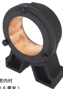
铜质内衬 钨 (6 毫米) 屏蔽/准直器