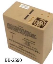
BB-2590 300 W-hr 外置电池