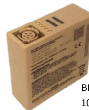
BB-2557 100 W-hr 内置电池